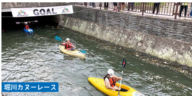
堀川カヌーレース